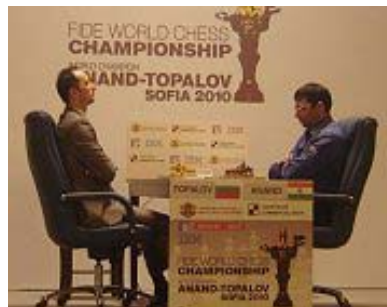
Die Schachgiganten bei WM in Sofia links Herausforderer W. TOPALOW rechts V. ANAND

Mit den weißen Steinen hatte Topalov heute zum letzten Mal die Chance, durch einen Sieg den drohenden Stichkampf zu vermeiden. Anand überraschte den Herausforderer jedoch erneut, diesmal mit dem zuvor noch nicht gespielten Abgelehnten Damengambit. Die von Anand gewählte Lasker-Verteidigung gilt als sehr solide und tatsächlich holte Topalov keinerlei Vorteil aus der Eröffnung. In ausgeglichener Stellung ließ Topalov völlig unerwartet einen leicht zu verhindernden Bauerndurchbruch zu (30...f5 31.fxe4 e4) und sah sich danach einem mörderischen Königsangriff ausgesetzt. Obwohl Anand im Angriff einmal die beste Fortsetzung verpasste, reichte es für den Weltmeister zum Sieg und zur Titelverteidigung. Damit entschied der erste Schwarzsieg auch den Wettkampf. Endstand: 6,5:5,5.